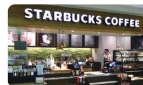
スターバックスコーヒー