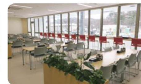
レストラン はすの実