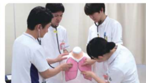
フィジカルアセスメント