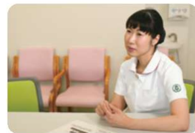
精神看護専門看護師