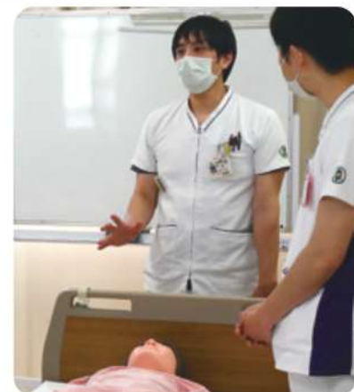
救急看護認定看護師