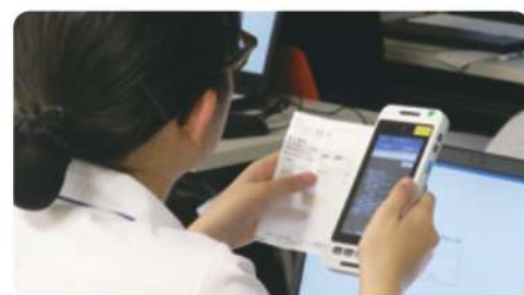
システム操作訓練