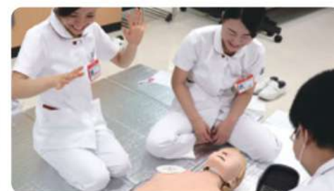
成人の一次救命処置