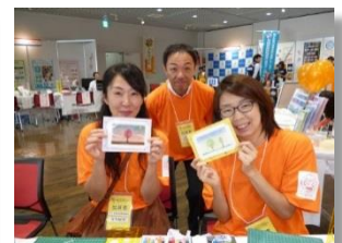
和みアート体験コーナーにて