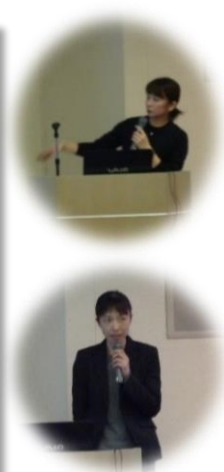
セミナーの content はいかがでしたか？